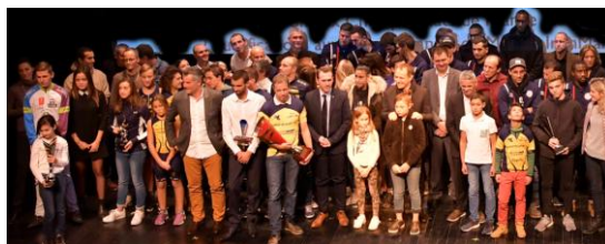
Compte rendu de la réunion du 28 mars 2018 – Salle 108 de l'OMS

Télécharger le dossier de demande de subvention de fonctionnement et de projet associations sportives 2018 ici