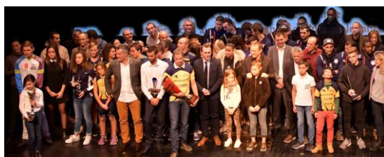
Compte rendu de la réunion du 28 mars 2018 – Salle 108 de l'OMS

Christophe rappelle que bon nombre de clubs estiment que nouvelles inscriptions ont été générées suite à l'édition de ce guide et notamment lors de sa distribution à la journée des associations