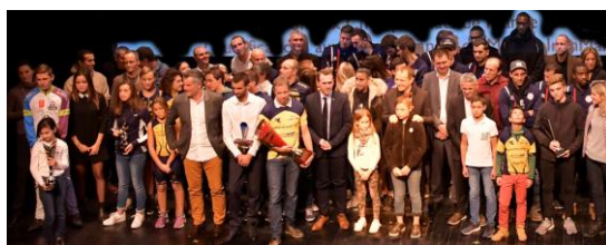
Compte rendu de la réunion du 28 mars 2018 – Salle 108 de l'OMS