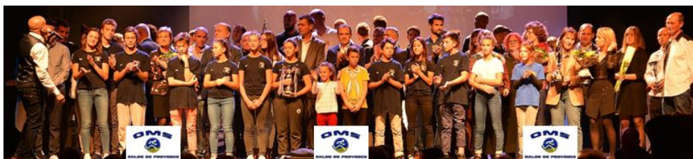
Compte rendu de la réunion du 11 octobre 2017 – Siège du SAPELA Basket 13

Marc Sapin rejoint Christophe dans cette optique et préconise de se rapprocher des expériences des villes jumelées avec Salon de Pce.