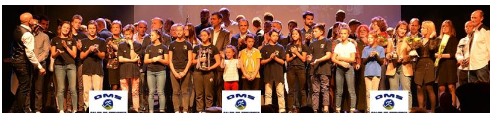
Compte rendu de la réunion du 11 octobre 2017 – Siège du SAPELA Basket 13