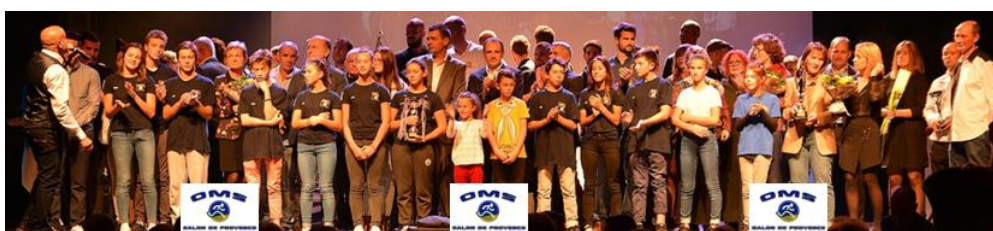
Compte rendu de la réunion du 11 octobre 2017 – Siège du SAPELA Basket 13

M Diaz est donc chargé de la gestion des espaces associatifs et a donc à sa charge les réservations des salles (C Trenet, MVA, ...).