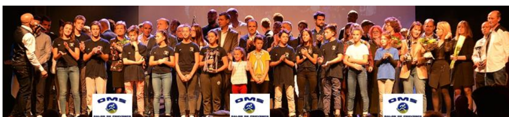
Compte rendu de la réunion du 11 octobre 2017 – Siège du SAPELA Basket 13

Proposition de services du cabinet comptable Etang de Berre Expertise