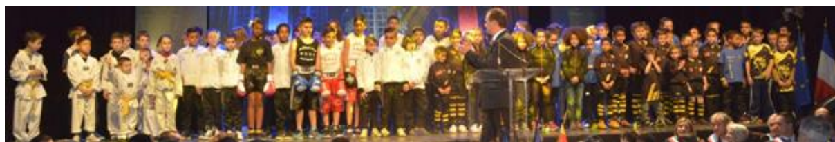
Compte rendu de la réunion du 04 octobre 2016 – Siège du Rugby Club Salon XIII

Salariée Municipalité - Mise à disposition OMS Sage de l'OMS