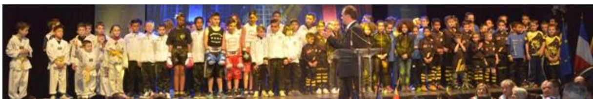
Compte rendu de la réunion du 23 Aout 2016 – Siège du SAPELA