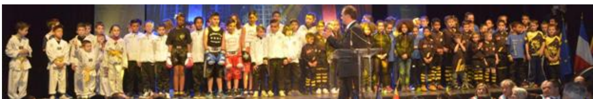
Compte rendu de la réunion du 23 Aout 2016 – Siège du SAPELA