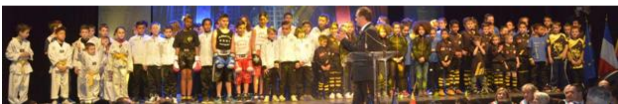
Compte rendu de la réunion du 23 Aout 2016 – Siège du SAPELA

Il appelle les clubs à lui faire part de leurs projets.