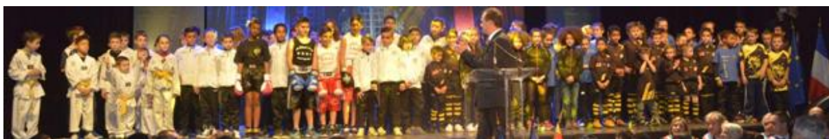
Compte rendu de la réunion du 23 Aout 2016 – Siège du SAPELA

Conseiller du président Personnalité du sport – Club des Nageurs Salonais Salon Hockey Club