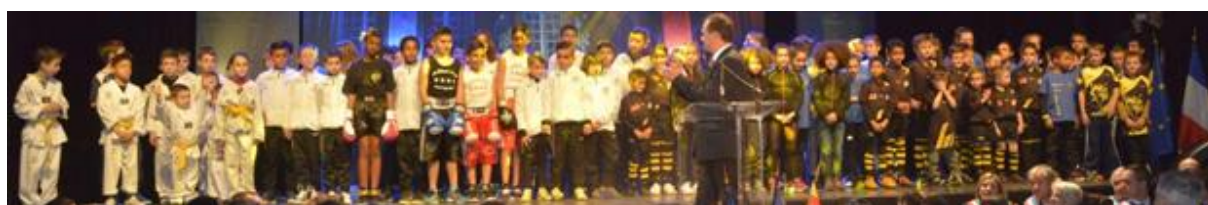
Compte rendu de la réunion du 23 Aout 2016 – Siège du SAPELA